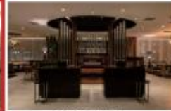
7階ロビーラウンジ